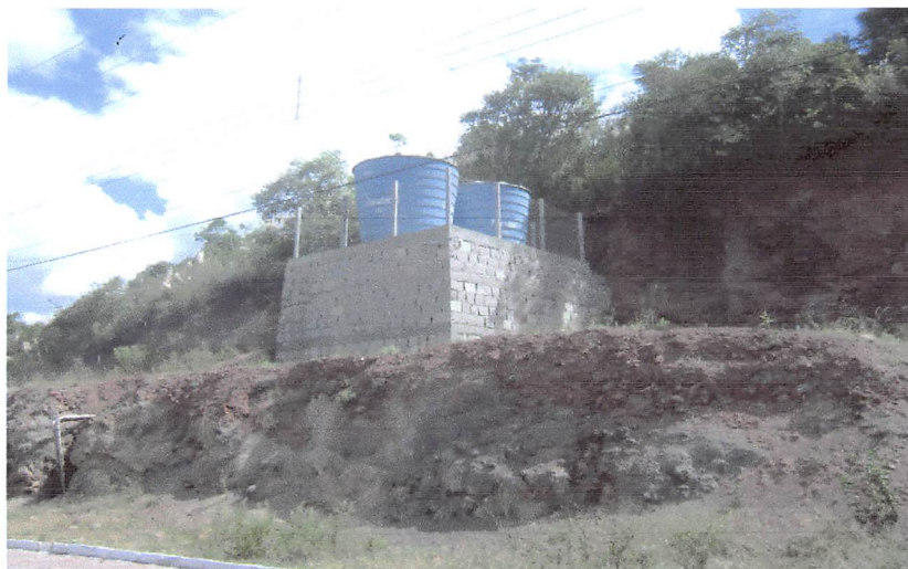
Foto 1 - Vista do terreno