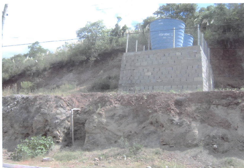
Foto 2 - Vista frontal