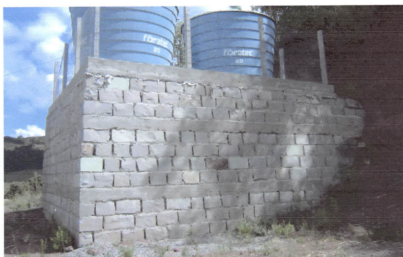
Foto 3 - Base para caixas d'água