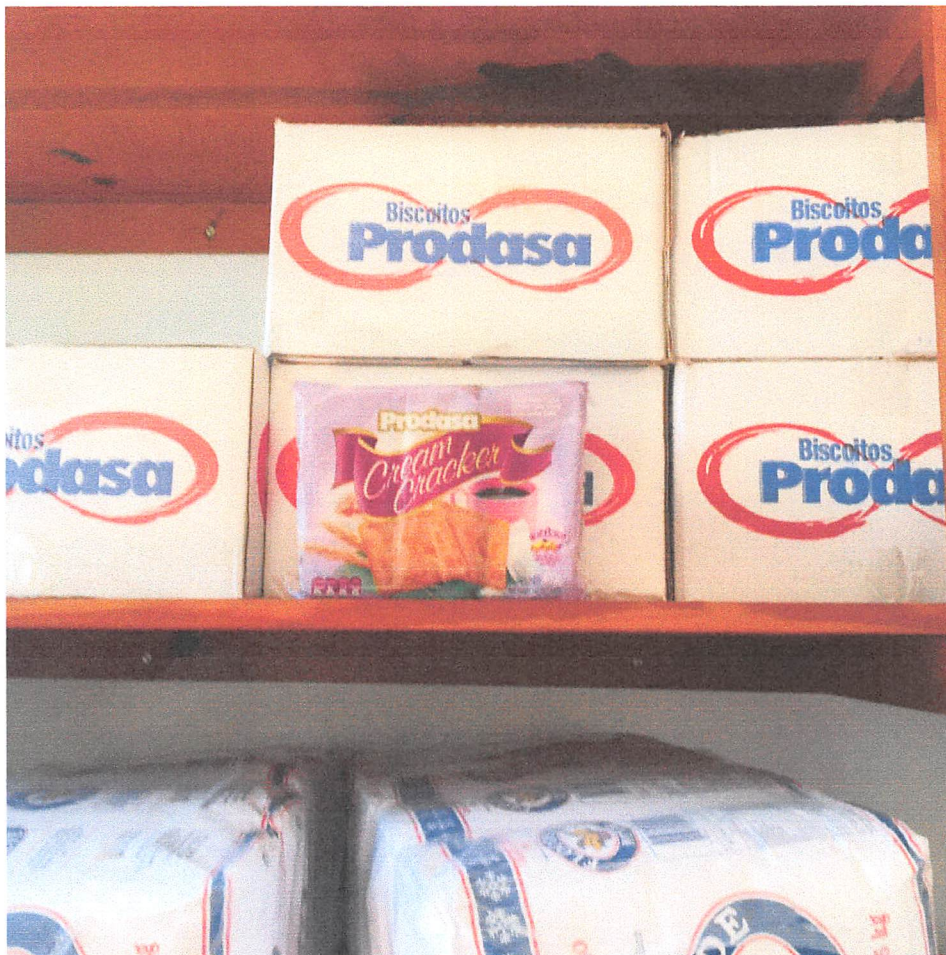
Imagem 04: BISCOITO MARIA

Marca licitada DIANA, marca que esta sendo recebida PRODASA. Valor R$ 6,38